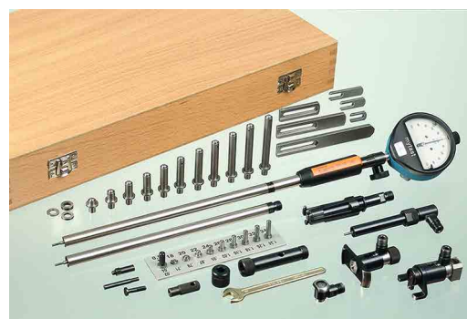
Serie VARIO SVS