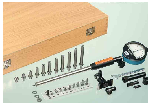
Serie VARIO SV