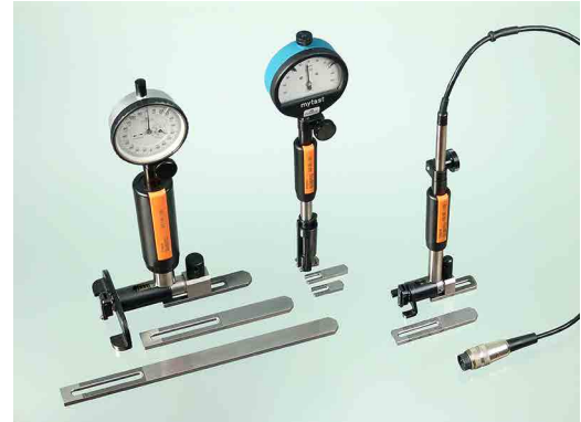
Lieferung ohne Feinzeiger, Messuhr, elektr. Messtaster