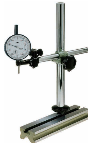
Lieferung ohne Messuhr